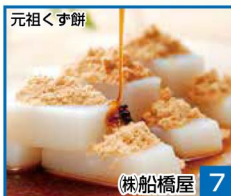
元祖くず餅 7 株船橋屋