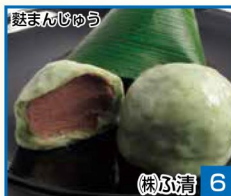
駄まんじゅう 6 株心清