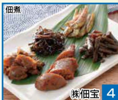
佃煮 4 株佃宝