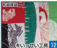
和装雑貨 12 有いっせい工房