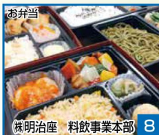
お弁当 8 株明治座 料飲事業本部