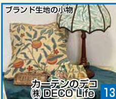
ブランド生地の小物 13 カーテンのデコ 株DECO Life