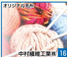
オリジナル毛糸 16 中村織維工業株