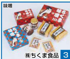
味噌 3 株式会社くま食品