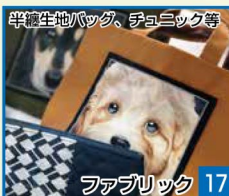
半端生地バッグ、チョニック等 17 ラザブリック