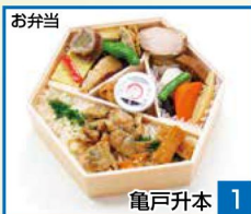
お弁当 1 亀戸升本