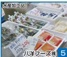
水産加工品 5 八洋フーズ株