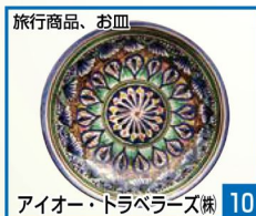
旅行商品、お皿 10 アイオー・トラベラズ株