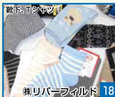
靴下、Tシャツ 18 株リバーフィールド