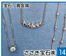
宝石、貴金属 14 ささき宝石株