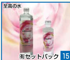
至高の水 15 有セットバック