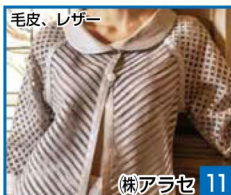
毛皮、レザー 11 株アラセ