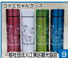
コトミちゃんグッズ 9 一般社団法人江東区観光協会