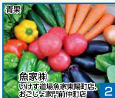
青果 2 魚家株 いけす道場魚家東陽町店、 おこしな家門前仲町店