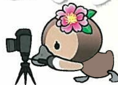
江東区観光キャラクター コトミちゃん

「魅力百様、江東区。オンライン観光写真コンテスト」とは、江東区の観光情報を発信する一般社団法人 江東区観光協会が主催の写真コンテストです。