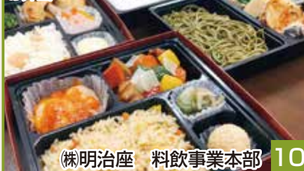
(株)明治座 料飲事業本部