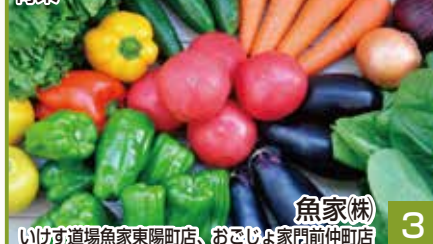
魚家(株) いけす道場魚家東陽町店、おごじよ家門前仲町店