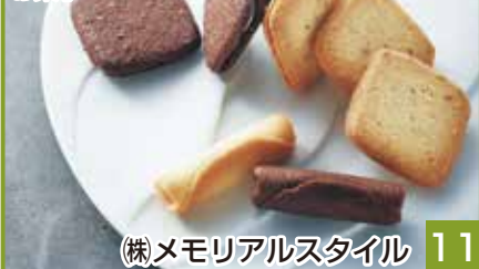
(株)メモリアルスタイル