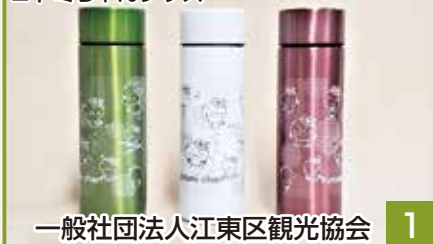
一般社団法人江東区観光協会