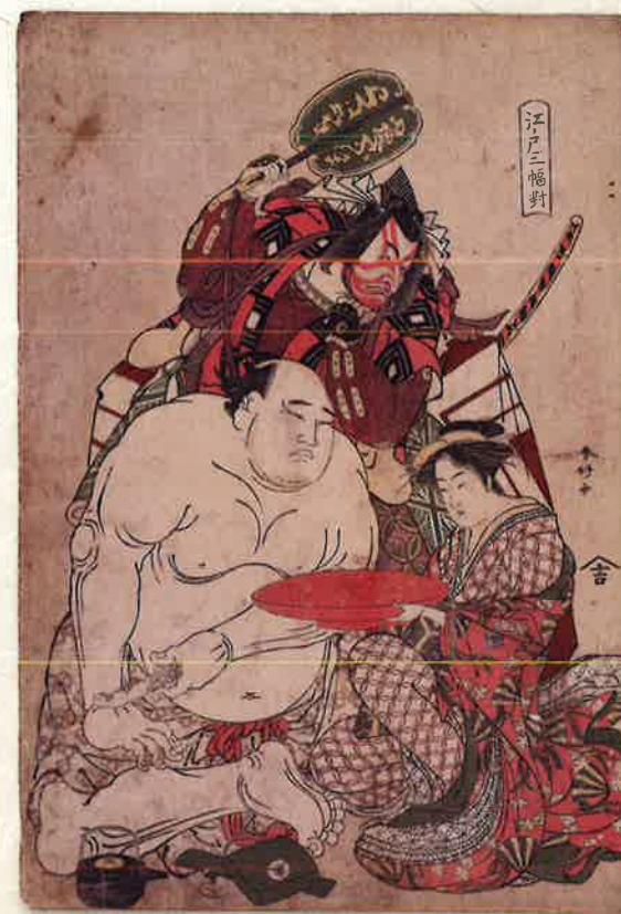
「江戸三幅野」力士谷風・市川團十郎・扇屋花扇 勝川春好画 東京国立博物館蔵