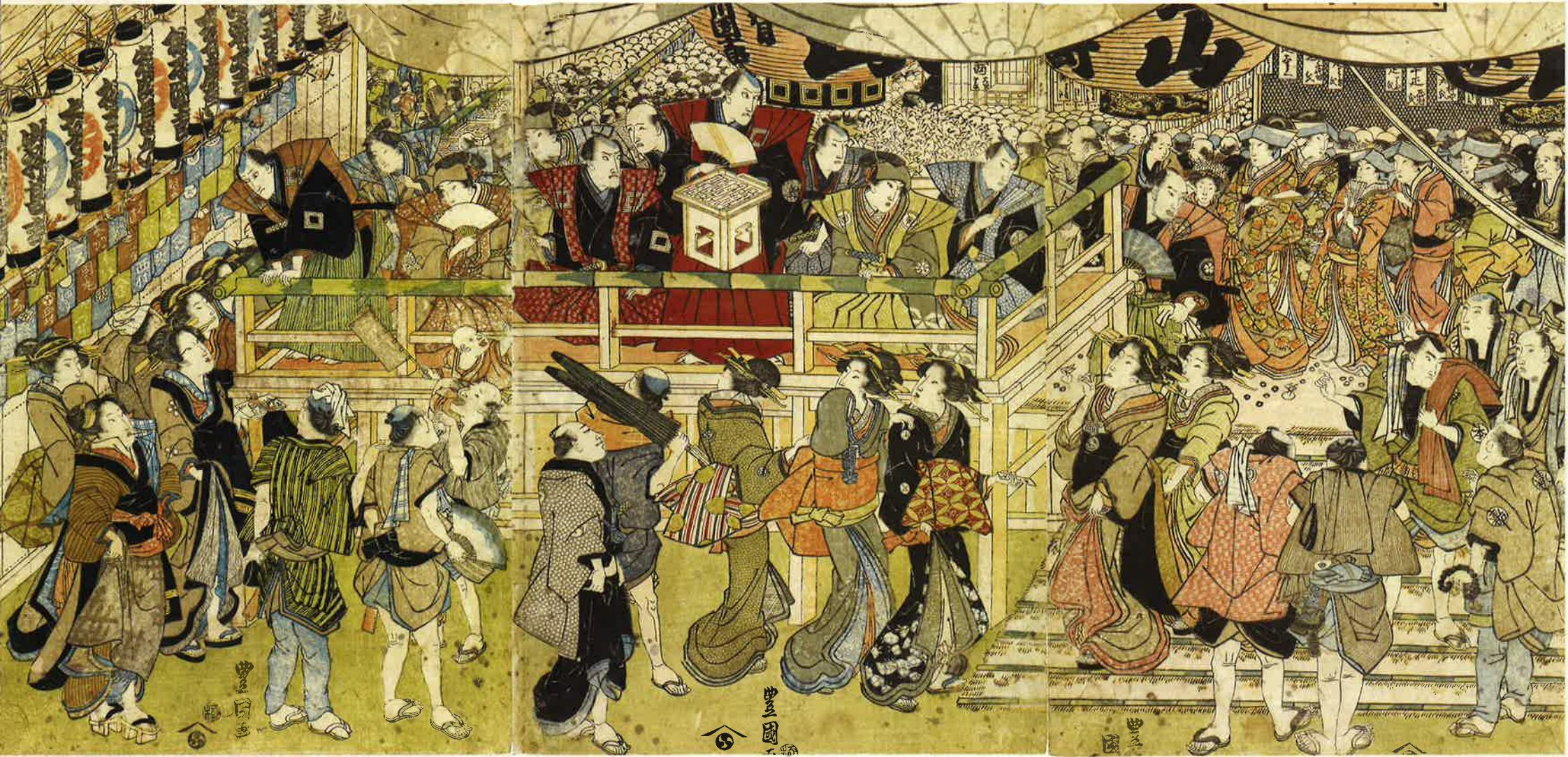
「成田山出開帳図」

〒135-0021 東京都江東区白河1-3-28 Tel.03-3630-8625