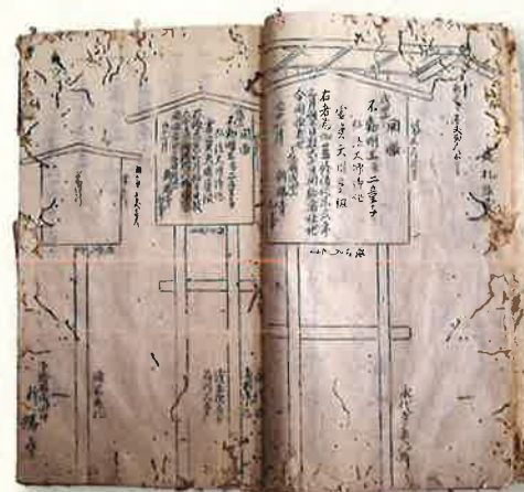
「深川出開帳記録」(出開帳立札) 成田山靈光館蔵