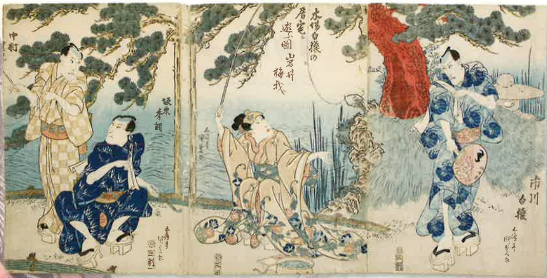
「木場 白猿の居室に遊ぶ図」五波亭国貞画 江東区教育委員会蔵