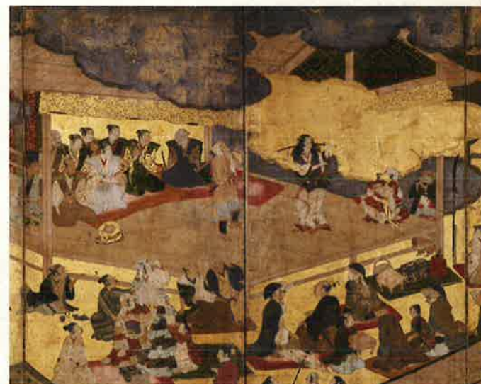
「阿国歌舞伎図」(部分) 京国立博物館蔵

深川 は、市川團十郎をはじめ、 歌舞伎役者、狂言作者ゆかりの地であり、 歌舞伎の舞台としても 数多く描かれています。