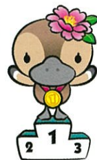
江東区観光キャラクター コトミちゃん