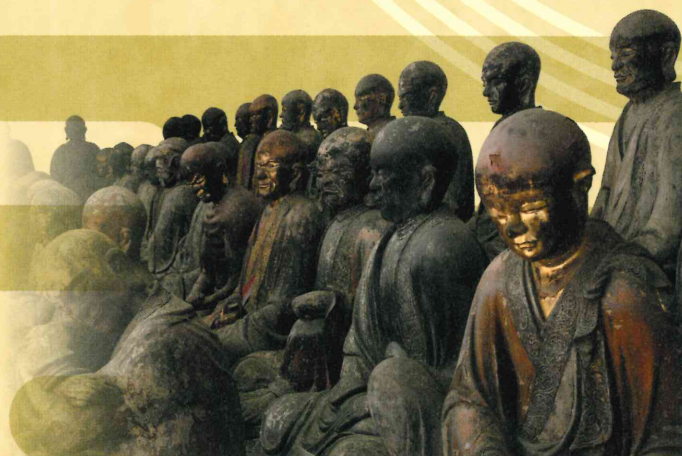
羅漢堂内・羅漢像群