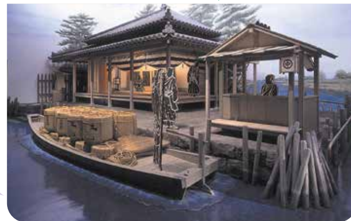
発掘調査や歴史資料に基づいて再現された中川番所のジオラマ