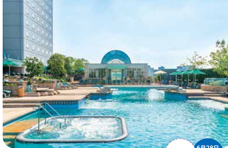
30×11mの広々としたメインプール。水深は1.3m