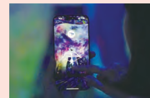
Catching and Collecting Extinct Forest

「捕まえて集める絶滅の森」を楽 しむ前に、アプリのダウンロードを。 アプリの図鑑にコレクションした動 物を観察したり、作品空間にリリー スしたりできます。