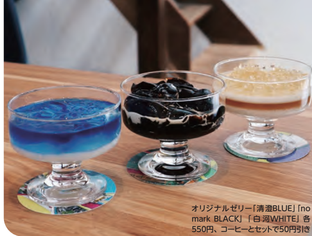
オリジナルゼリー「清澄BLUE」[no mark BLACK]「白河WHITE」各550円、コーヒーとセットで50円引き