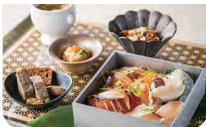
「フレンチ海の幸重御膳(ディナーメニュー)」4746円

アラカルトからシェフのスペシャルコース、デザート、ドリンクまで多彩なメニューがそろいます