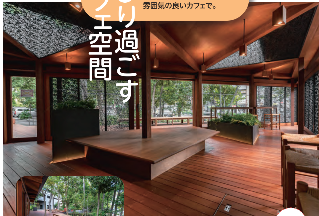
木々の中を吹き抜ける風を感じられるテラス席も

忙しい日常から離れて、 ちょっと一息つきませんか。 こだわりのドリンクや フードを味わえる、 雰囲気の良いカフェで。