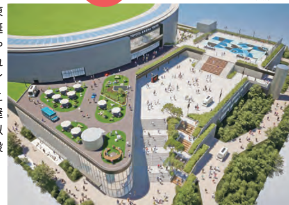
@TOYOTA ARENA TOKYO