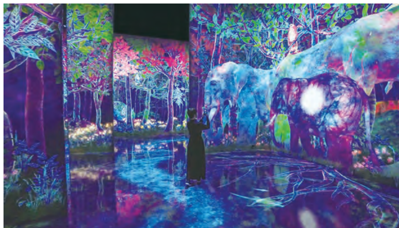
チームラボ《つかまえて集める絶滅の森》©チームラボ

DATA 青海1-3-15 不定休、チケット事前購入可 1万4800円（約70分） ※18歳以上限定 ゆりかもめ「青海」駅直結 MAP ②